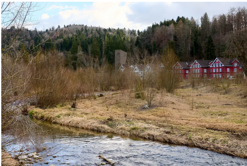
Blick von Brücke bei Ziegelhütte.

Wettbewerb als Sieger hervorgegangen war. Die Stimmberechtigten der Korporation Baar-Dorf hatten den Kredit von 1,6 Millionen Franken für die Realisierung des Schlaufenstegs 2019 genehmigt. Die für 2020 geplante Realisierung wurde jedoch durch verschiedene Einsprachen verzögert.